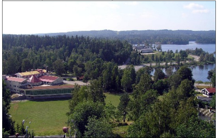
Utsikt från hopptornet i Hindås

förbättras och trafikeras har inte gett några avtryck i inriktningsmålen.