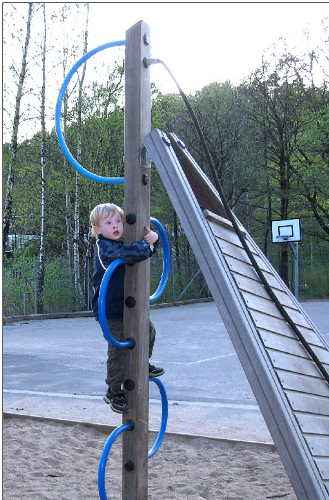
Tidig hjälp är en förutsättning för att slippa problem högre upp i tonåren.