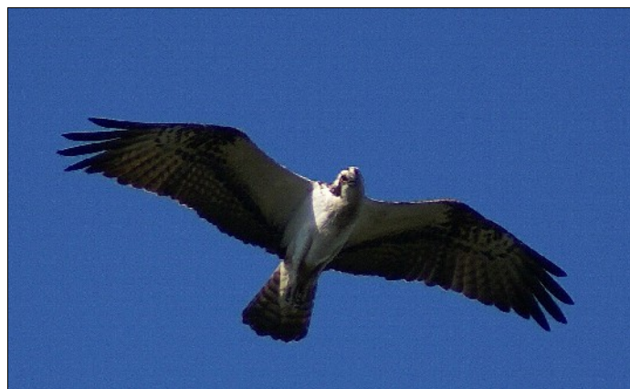
Detta försvinner om Landvetter Park blir verklighet.